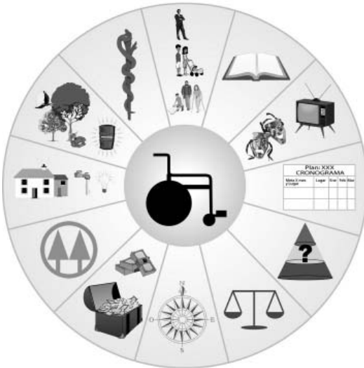
Fig. N° 2. Modelo Integral de la Discapacidad

Igualmente si trasladamos esta visión a la estructura orgánica de un comité local de atención, obtendremos la comisión sectorial del comité local de atención a las personas con discapacidad, con doce (12) personas elegidas como delegados y delegadas principales de las personas con discapacidad, ubicadas según su vocación natural en cada uno de los sectores de la realidad del proceso de discapacidad, a saber: